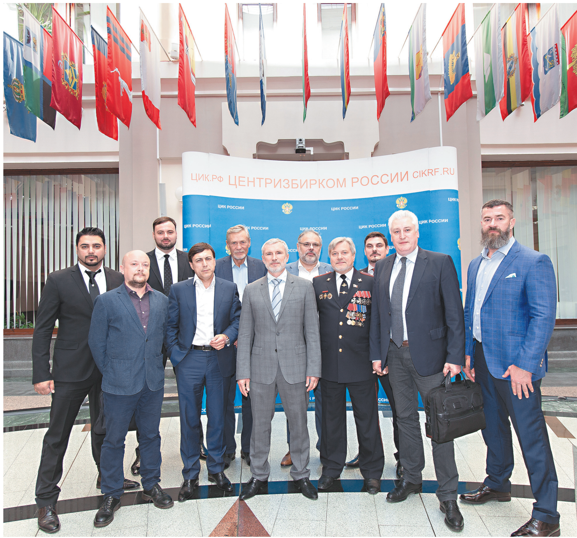
ПАРТИЯ «РОДИНА» — Национальный фронт за стабильную и достойную жизнь в сильной России.

Нам с вами, обычным гражданам, не составляет труда оценить реальное положение дел. Достаточно взглянуть к себе в кошелёк и холодильник. Если там пусто, то и в стране не густо. Сегодня зарплаты большинства россиян не хватает на нормальную и достойную жизнь. Наш труд обесценен, что, впрочем, не мешает многим работодателям по-прежнему извлекать из результатов нашей работы сверхприбыли. У нас затраты на зарплату в стоимости единицы продукции в 4 раза меньше, чем в развитых странах. И с каждым но-